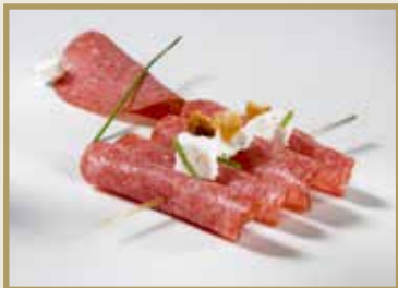
Taganr. 2002 Salami, skåret, 6 x 1 kg. Kjøøl