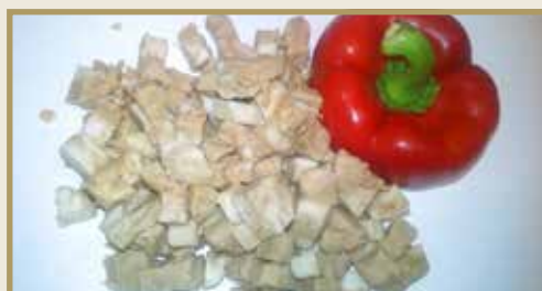
Taganr. 3001 Epdnr. 4150629 Lapskauskjøtt av svin, kokt, ternet, 5 kg. Frys