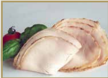
Taganr. 2068 Kamstek, skåret, 4 x 400 g. Kjøøl