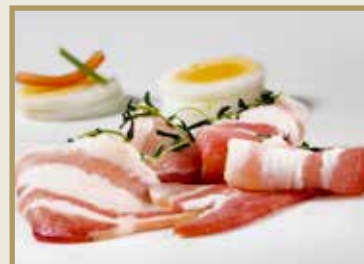
Taganr. 1044 Epdnr. 442731 Bacon, skåret, u/svor, vac, 8 x 1 kg. Kjøøl