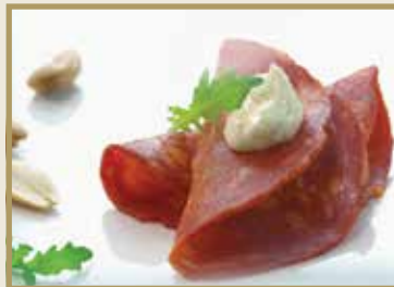
Taganr. 5003 Chorizo, skåret, 4x400g. Kjøøl