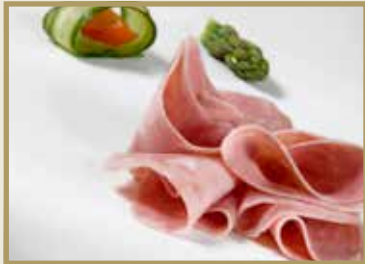
Taganr. 1068 Kokt skinke, skåret, 4 x 400 g. Kjøøl