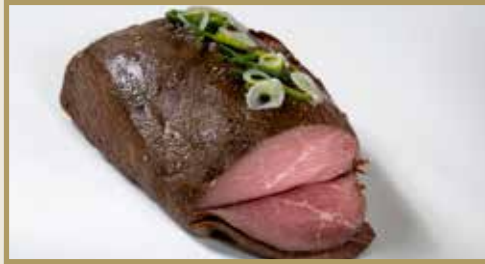
Taganr. 1545 Roastbiff av rundstek, hel, 5 x ca. 1,7 kg. Frys