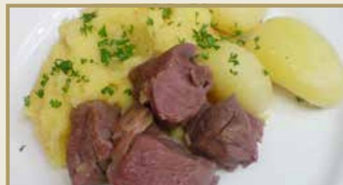
Taganr. 1035 Epdnr. 1434836 Fårebog, oppdelt, ub, salt, 8 x 1 kg. Frys