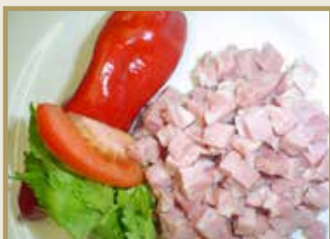
Taganr. 1046 Epdnr. 1560085 Salatskinke, kuttet, 8 x 1 kg. Kjøøl