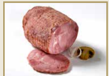
Taganr. 1049 Svinebog, hel, ub, røkt/kokt, nett, 5 x ca. 1,8 kg. Kjøøl