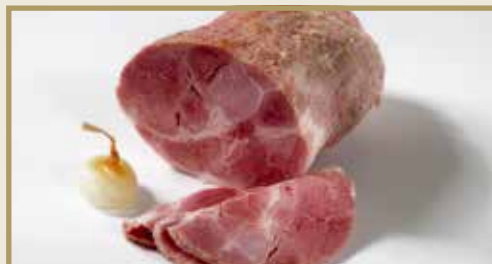
Taganr. 1032 Epdnr. 373506 Svinebog, hel, salt, ub, 3 x ca. 2,5 kg. Frys