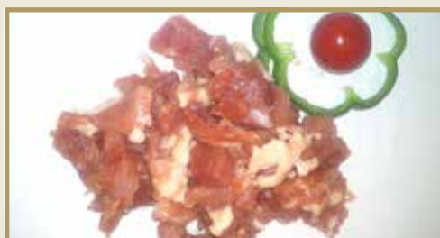
Taganr. 3002 Epdnr. 4150611 Lapskauskjøtt av svin, salt, ternet, 6 kg. Frys