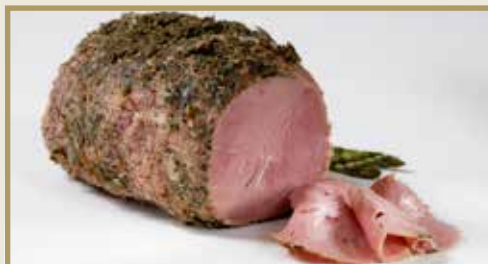
Taganr. 1027 Epdnr. 373431 Svinenakke, hel, urtemarinert, kokt, 4 x 2 kg. Kjøøl