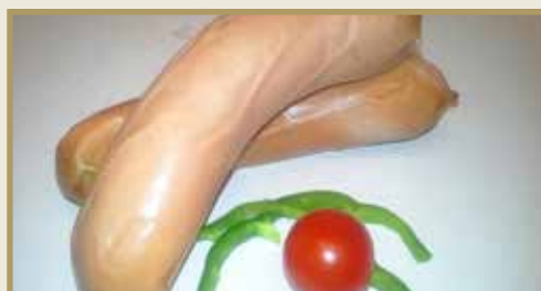
Taganr. 1016 Epdnr. 882092 Røkt kjøttpølse, kokt, 5 kg. Frys