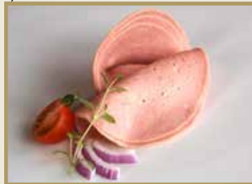
Taganr. 1513 Servalat, skåret, 12 x 400 g. Kjøøl