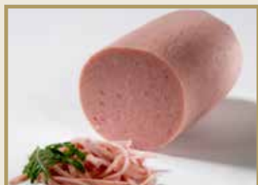
Taganr. 1057 Epdnr. 378091 Pizzapålegg, hel, rund, 3 x ca. 2,5 kg. Kjøøl