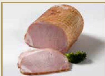
Taganr. 1048 Epdnr. 373456 Svinekam, hel, ub, røkt/kokt, nett, 4 x ca. 2 kg. Kjøøl