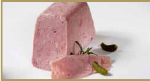
Taganr. 1053 Kokt skinke, hel, 3 x ca. 2,5 kg. Kjøøl