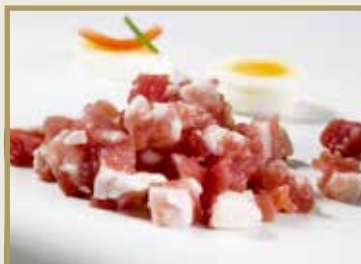
Taganr. 1040 Epdnr. 463547 Bacon, terninger, u/svor, vac, 8 x 1 kg. Kjøøl