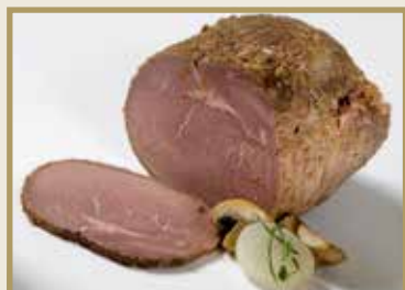
Taganr. 1030 Epdnr. 442665 Oksestek, hel, stekt, sky, 5 x ca. 1,7 kg. Kjøøl