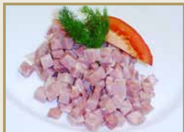
Taganr. 2079 Epdnr. 2151306 Toastskinke, kuttet, 8 x 1 kg. Kjøøl