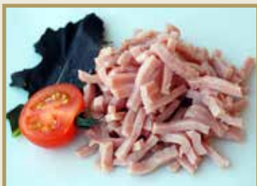
Taganr. 1263 Epdnr. 2151090 Pizzaskinke, strimlet, 8 x 1 kg. Kjøøl