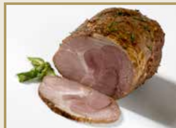
Taganr. 1031 Svinestek, hel, stekt, sky, u/svor, 5 x ca. 1,7 kg. Kjøøl