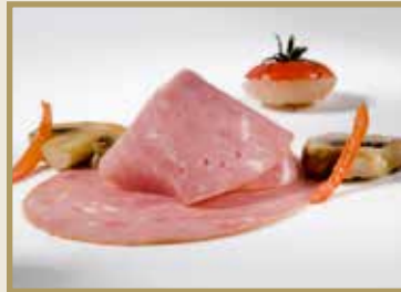
Taganr. 2074 Bogskinke, røkt, kokt, skåret, 4 x 400 g. Kjøøl