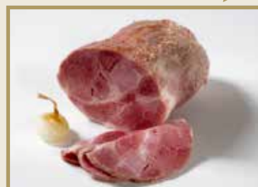
Taganr. 1034 Epdnr. 1370196 Svinebog, hel, ub, salt, kokt, 8 x 1 kg. Frys