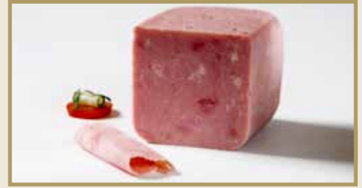
Taganr. 1050 Gjestepålegg, hel, 4 x 2 kg. Kjøøl