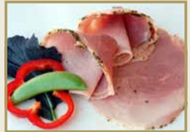
Taganr. 2110 Gourmet svinenakke, skåret, 4 x 400 g. Kjøøl