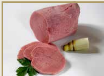
Taganr. 1052 Saltkjøtt, hel, 5 x ca. 1,5 kg. Kjøøl