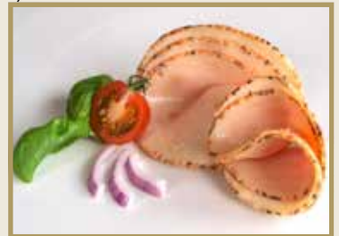
Taganr. 1084 Kylling pastrami, skåret, 4 x 400 g. Kjøøl