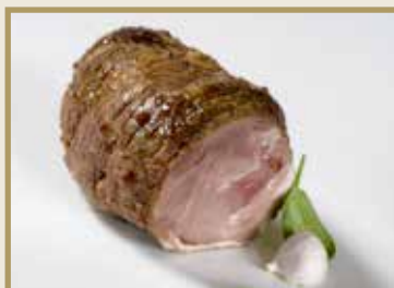
Taganr. 1033 Epdnr. 442756 Lammestek, hel, stekt, sky, 5 x ca. 1,7 kg. Kjøøl