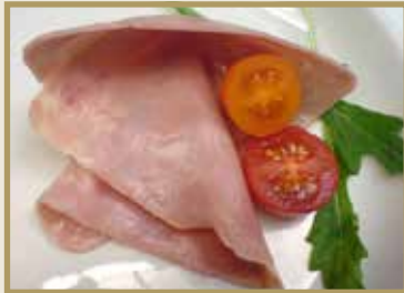
Taganr. 2077 Toastskinke, skåret, 12 x 500 g. Kjøøl