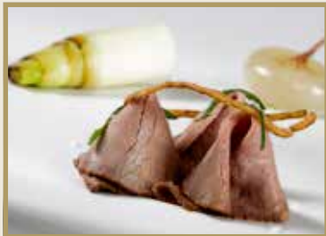
Taganr. 2072 Roastbiff av lårtunge, skåret, 4 x 400 g. Frys