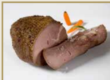
Taganr. 1023 Kalvestek, hel, stekt/sky, 5 x ca. 1,8 kg. Frys