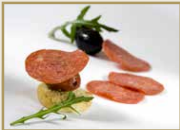
Taganr. 2006 Pepperoni, skåret, 6 x 1 kg. Kjøøl