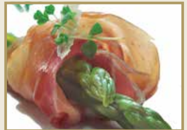
Taganr. 1564 Serranoskinke, skåret, 5x300g. Kjøøl