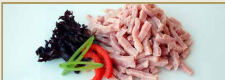
Taganr. 2080 Epdnr. 2151389 Toastskinke, strimlet, 8 x 1 kg. Kjøøl